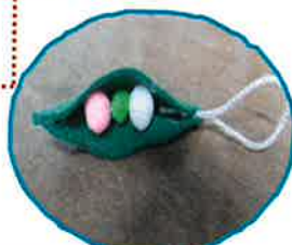
豆のストラップ (11月)