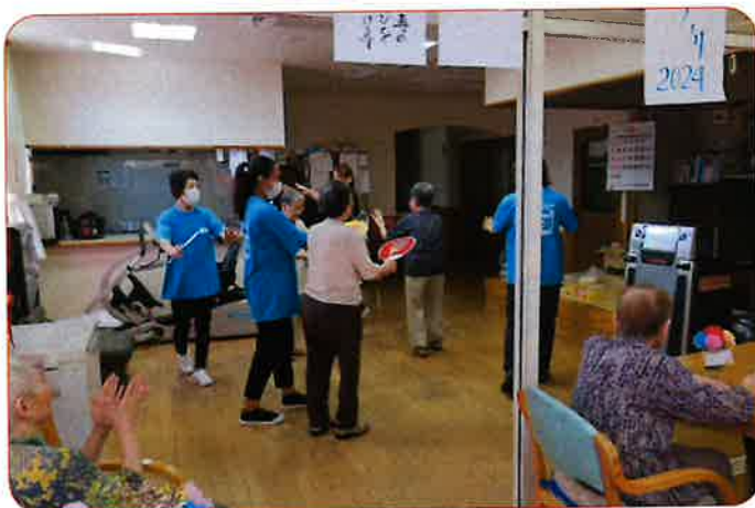
皆さん一緒に炭坑節を踊りました