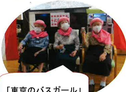
「東京のバスガール」