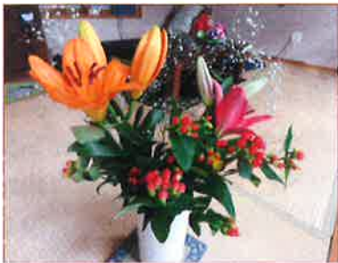
お花を飾りました