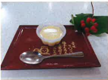
おやつにプリンを作りました