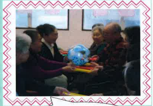
息合わせてそっと♡

体操の後は、棒を使ってのレクをしました。向かいの人と2人1組になってビーチボール送りをしました。隣から送られてくるボールをキャッチして落とさないように次に送るのは意外に難しいです。集中力が要ります。かか声や歓声で賑やかなレクになりました。