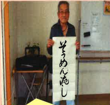
盆踊り大会とうちわの祭も、 書きました。