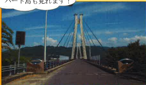
万葉歌碑・万葉陶壁