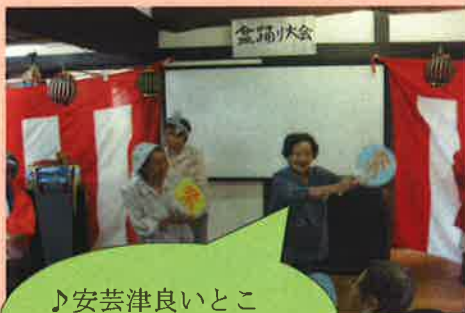
♪安芸津良いとこ 潮風うけ～て～