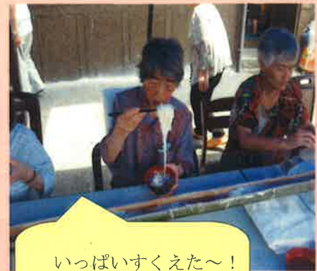
いっぱいすくえた～！ おいしそ～！(^)